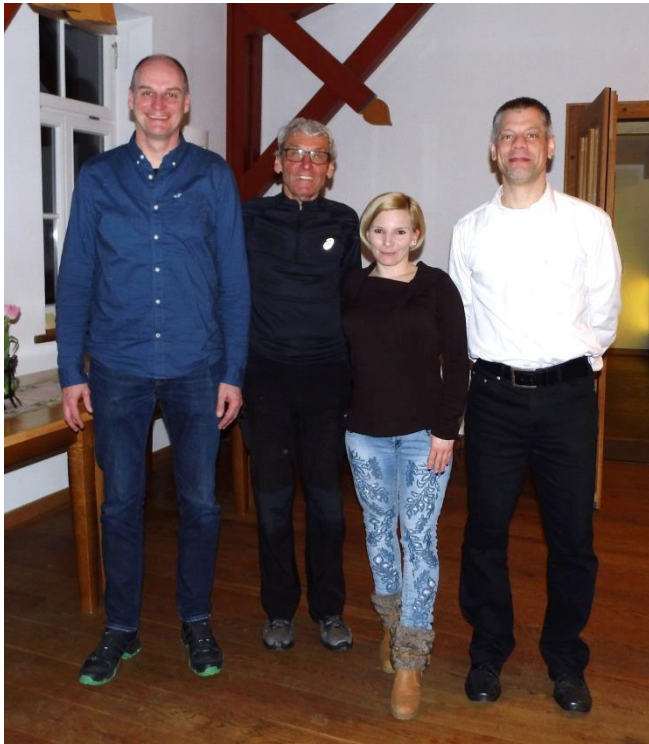
(Ehrung bei der Jahreshauptversammlung)